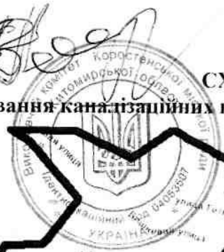
СХЕМА Розташування каналізаційних колодязів для зливу каналізаційних стоків